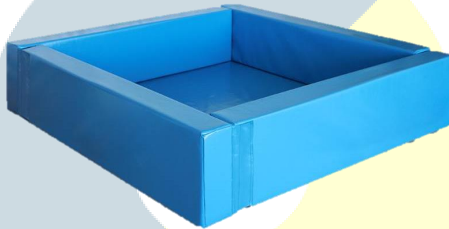
IMAGEN DEL ELEMENTO